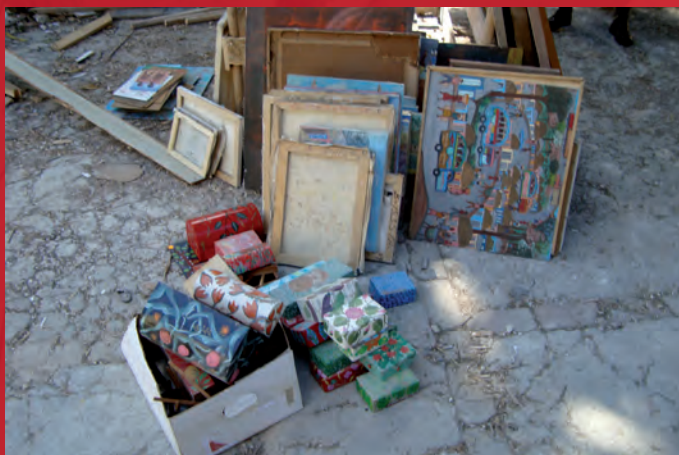
El Centro de Arte en Puerto Príncipe.

La Lista Roja de emergencia de bienes culturales haitianos en peligro es la primera publicación del programa del ICOM relativo a la protección del patrimonio cultural de La Española. Posteriormente se publicará una Lista Roja de bienes culturales en peligro de La Española , que describirá las categorías de objetos culturales especialmente amenazadas tanto en Haití como en República Dominicana.