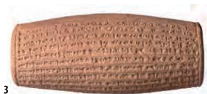
3. Cylindre d'argile avec inscriptions cunéiformes citant le nom du roi assyrien Assurbanipal, Babylone, VII e s. av. J.-C., Ø 17,6 cm.