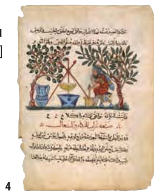
4. Folio écrit à l'encre et avec des aquarelles opaques et dorées, provenant d'une Materia Medica de Dioscorides et montrant un médecin préparant un élixir, probablement de Bagdad, 1224 ap. J.-C., 33,2 x 24,8 cm.