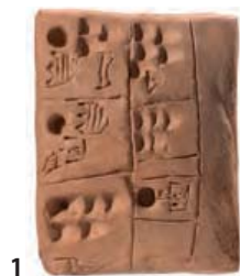
1. Tablette cunéiforme en argile, Uruk, ca. 3200 av. J.-C., 5,7 x 4,3 cm.

Manuscrits, livres et documents : codex, corans et textes scientifiques. Papier ou parchemin avec des écrits araméens et/ou arabes. Souvent dotés d'enluminures. [4]