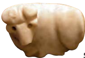
5. Sceau en calcite à bandes en forme de bélier, Tell Agrab, période d'Uruk (ca. 4000 – 3100 av. J.-C.)

Sceaux-cylindres : pouvant porter des inscriptions cunéiformes. Taille : 2-7 x Ø 1-3 cm. [7]