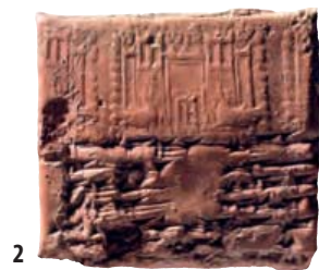
2. Tablette d'argile avec impression de sceau représentant deux chèvres devant une construction, Assur, XII e – XI e s. av. J.-C., 6,5 x 6,7 cm.