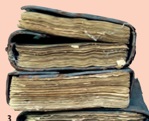
3. Livres en papier à couvertures en cuir, Tombouctou, XIII e – XVII e s. ap. J.-C., 22 x 18 cm.