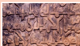
1. Stèle funéraire en marbre blanc, Nécropole de Sané (région de Gao), XII e – XIII e s. ap. J.-C., 88 x 44 cm.