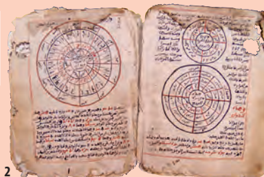
2. Manuscrit en parchemin, Tombouctou, XIII e – XVII e s. ap. J.-C., 26,5 x 41 cm.