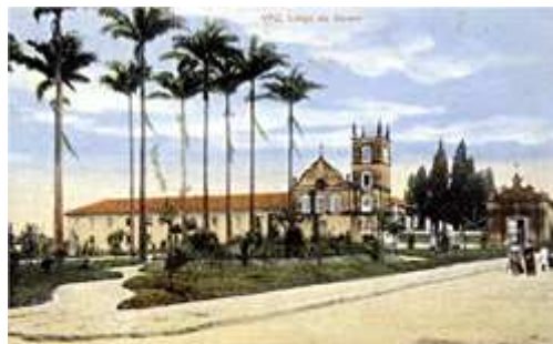
Carmo Church, Itu-SP, Brazil - Century 18 (postcard, 1910)