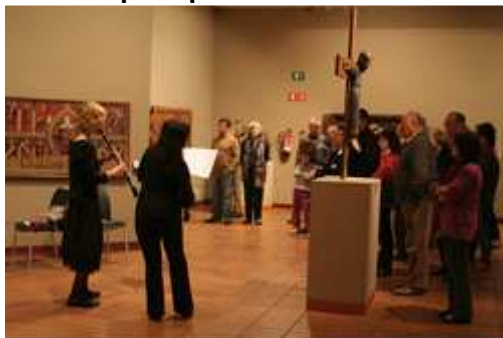
Nuit des musées au Museu episcopal de Vic