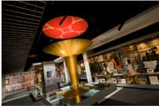
La vasque des Jeux Olympiques de Melbourne en 1956 dans la Faster, Higher, Stronger Gallery du National Sports Museum

Se souvenir des moments qui nous ont construits (18 mai 2011, 11h-13h).