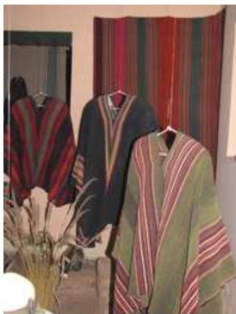
Ponchos de la región central del país. Dépt. Potosí, Bolivie.