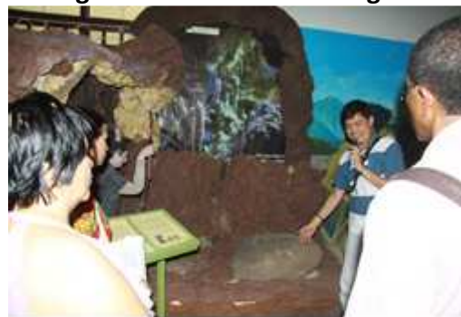
Journée internationale des musées à Sorsogon