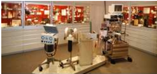
Le musée Harry Daly au siège de l'ASA.