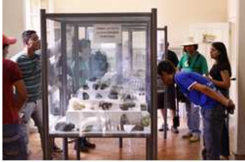
Activités au Museu de Ciências da Terra Alexis Dorofeef © MCTAD