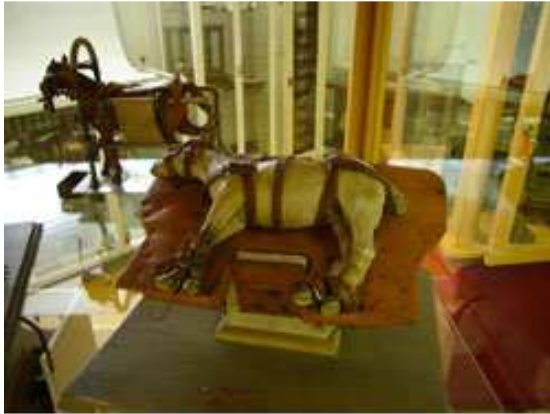
Lit d'opération modèle Schneider 1914

Matériel historique des vétérinaires militaires (du lundi au vendredi de 9h30 à 14h. Pour les groupes, convenir d'une visite)