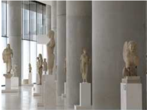
Salle d'exposition au Nouveau Musée de l'Acropole d'Athènes, Grèce.