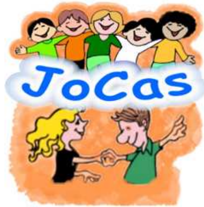
Logo Historisch Museum JoCas.