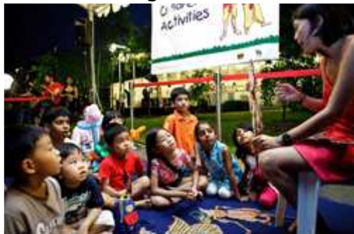
Singapore Peranakan Museum