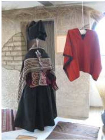
Costume traditionnel aymara de mama thalla. Région Aroma, dépt. La Paz, Bolivie.