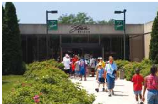
Le Sloan Museum est parfait pour se divertir en famille !