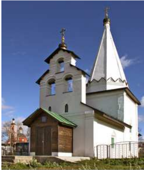
Lytkarinsky Museum