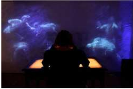
Museo Laboratorio della Mente