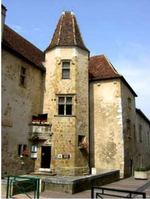
« Maison Jeanne d'Albret »