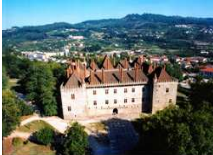
Paço de Duques