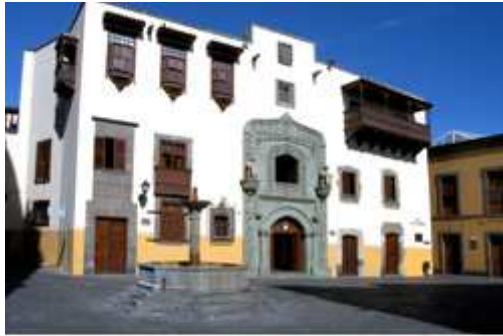
Façade de la Casa de Colón, Place du Nouveau Pilier