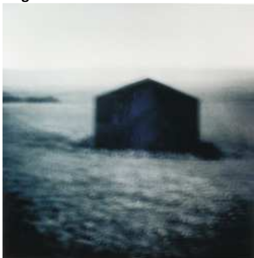
Michal Rovner, Outside , no. 17, 1991.