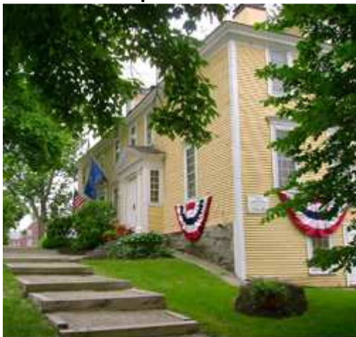
La Ladd-Gilman House (1721), un des deux bâtiments comprenant le American Independence Museum, qui raconte l'histoire de la lutte des Etats Unis pour la liberté et sa fondation.