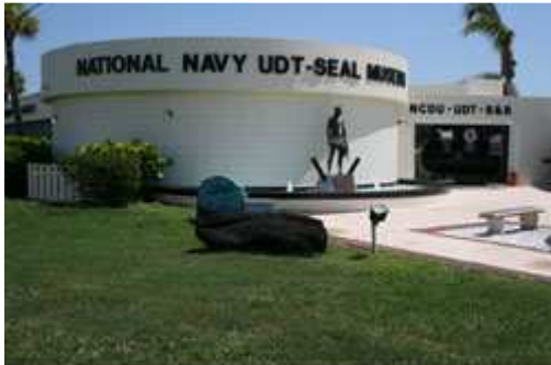
National Navy SEAL Museum

Mentionnez la «Journée internationale des musées» pour des entrées gratuites (mercredi 18 mai 2011)