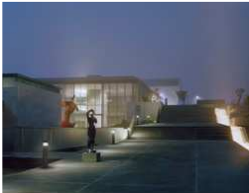
Vue de nuit du nouveau pavillon d'entrée de la galerie du Musée d'Israël depuis Carter Promenade, avec « Apple Core » de Coosje van Bruggen et Claes Oldenburg et « Turning the World Upside Down » d'Anish Kapoor.