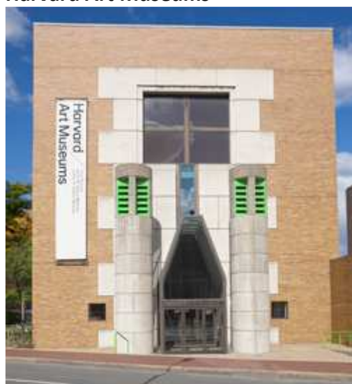
Harvard Art Museums. Arthur M. Sackler Museum, Cambridge, MA.