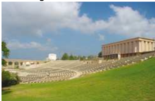
Ghetto Fighter House