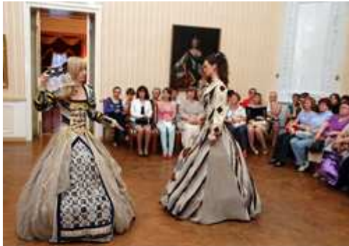
Scène de bal Copyright: Mazilova