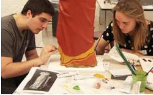
Des étudiants de Stanford travaillant sur la réplique d'une statue.