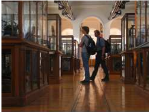
Visiteurs au Musée des Arts et Métiers