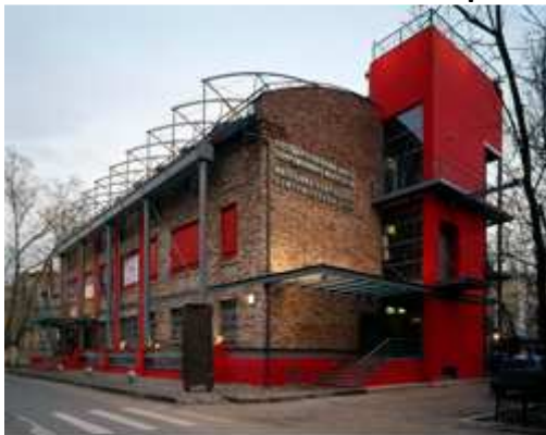
Le bâtiment de la NCCA, Moscou