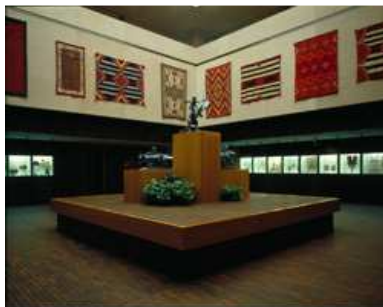
Lobby, Stark Museum of Art, Orange, Texas, USA.