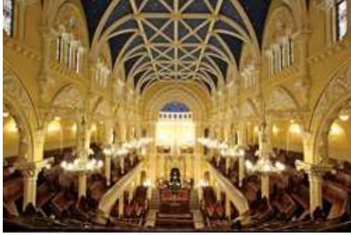
Intérieur de la Grande Synagogue, Sydney.