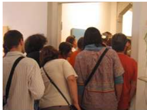
Découverte de l'art contemporain au musée.