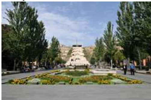
Cafesjian Center for the Arts © Cafesjian Museum Foundation