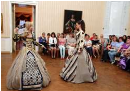
Scène de bal