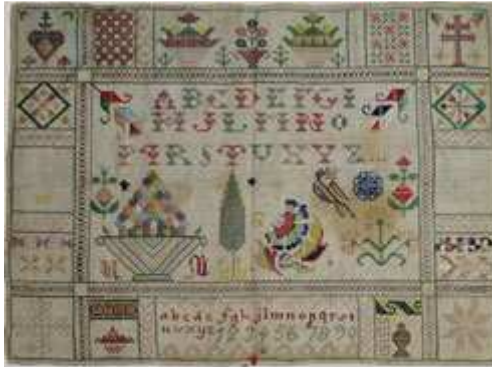
Collection textile pédagogique