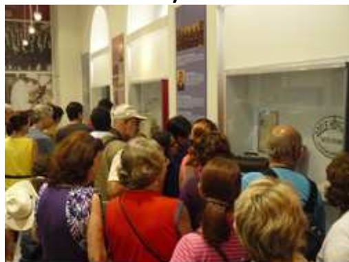
Visites au MUHM