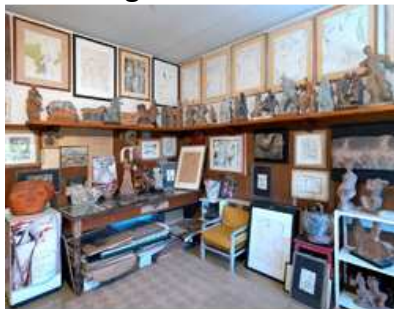
Atelier du Musée Ugo Guidi