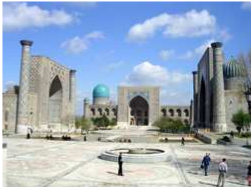
Registan Square – l'ancien forum de Samarkand.