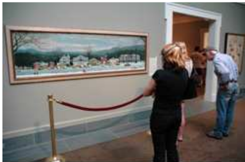
Les visiteurs du Norman Rockwell Museum admirant la peinture de Norman Rockwell, Golden Rule. © 1961 SEPS : Licensed by Curtis publishing, Indianapolis, IN.