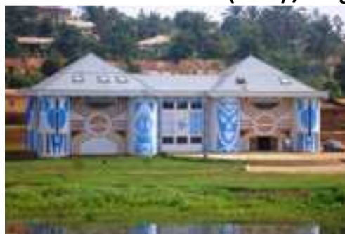
Musée des Civilisations à Dschang (façade principale)