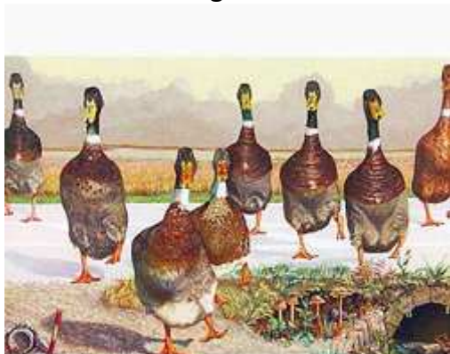
Runnerducks : peinture à l'huile de Sulpicius Bertsch