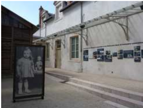
La cour du Cercil Musée - Mémorial des enfants du Vel d'Hiv