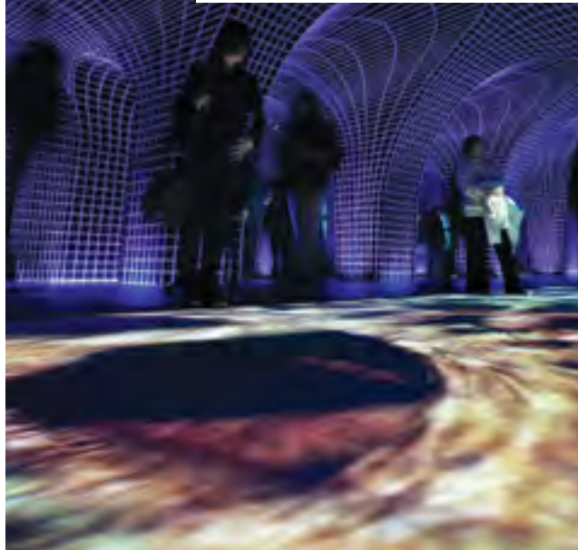
Museo della Storia di Bologna © Paolo Righi

Procurando siempre estar lo más cerca posible de los miembros de su red y difundir ampliamente los conocimientos de la organización, el ICOM se dotó en 2011 de nuevos medios de comunicación, mostrando así su gran dinamismo. También fomentó la actividad creciente de sus diferentes entidades y una representación geográfica más inclusiva para el conjunto de sus acciones.