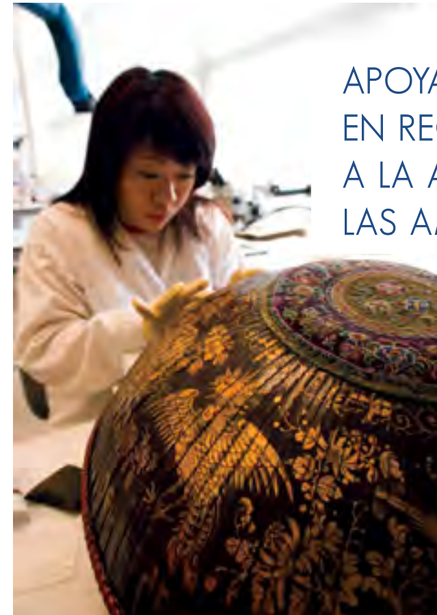
Singapore National Heritage Board

Corea, se llevó a cabo sobre el tema Protección del Patrimonio Cultural de la Humanidad en Tiempos de Cambio: Preparación y Respuesta a las Emergencias . La conferencia, cuya alocución de apertura fueron dadas por el Ministro de Cultura de Corea Choe Kwang Shik y Richard Kurin de la Smithsonian Institution, ha dado lugar a la publicación de la Declaración de Seúl sobre la Protección de los Bienes Culturales en Situaciones de Emergencia.