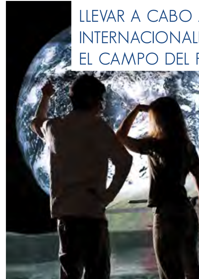
Cité des Sciences et de l'Industrie