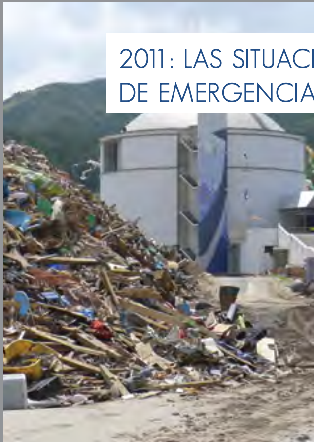
Yamada Town Whale and Sea Museum, Japan (2011)

El año 2011 fue un año marcado por la tristeza de muchos desastres naturales o humanos. La sucesión rápida de estos acontecimientos y en vistas de proteger los museos y los bienes culturales, necesitó la aplicación de mecanismos para prepararse y responder a las emergencias. Durante estas crisis, el ICOM, con el apoyo de su Grupo de Intervención y Socorro en casos de desastre para los Museos (DTRF), de algunos de sus comités nacionales e internacionales y de la red internacional del Escudo Azul, en el que ICOM es muy activo, actuó en el seguimiento y evaluación de la situación, en la preparación de medidas de respuesta apropiadas, en la difusión de información a través de su red internacional, así como en la participación y gestión de las misiones de evaluación in situ.