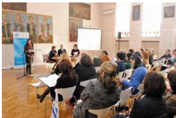
Seminar - Transformacija muzeja

postavljanje tematske strukture i fokusiranje na simboličan predmet oko kojeg se kreiraju ostale aktivnosti i priče – osmišljavanje niza programskih aktivnosti na temu jednog predmeta koji je odabran kao ključni predmet izložbe.