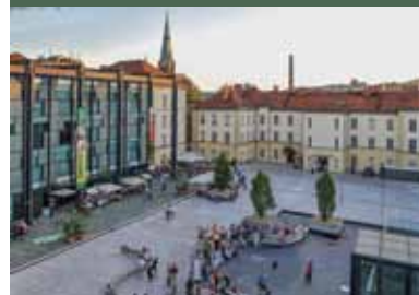
Etnografski muzej u Sloveniji

4. Dosta sam precizna po ovom pitanju. Ne mislim da bi svako trebalo da voli i da posećuje muzej. Mi moramo da slušamo našu publiku, ali naš rad mora da reflektuje etičku i profesionalnu pozadinu institucije (mesto od javnog značaja ). Dobro, promišljene i (zašto da ne) atraktivne (u dizajnu) izložbe su dobrodošle.