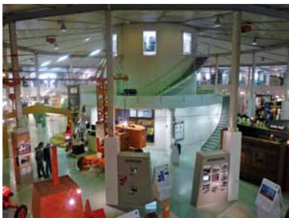
Muzej tehnike, Helsinki

većine fabrika, gradske vlasti odlučile su da ceo industrijski kompleks iz 19. veka zaštite i popune ga novim sadržajem. Tako se danas u modernom industrijskom okruženju našlo istorijsko, kulturno i poslovno središte, u kome su smešteni: Muzejski centar Vapriki, Finski muzej rada Verstas i Muzej medija Rupriki. Poslednji dan učesnici Konferencije su proveli u Kući eksperimenata Eureka (Finski naučni centar Eureka) u mestu Vantaa i Muzeju tehnologije u Helsinkiju.