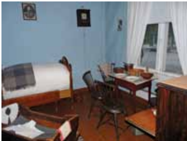
Radnici stan, Radnički muzej stanovanja Amur

muzejem, želi da uspostavi stalno učešće u postavljanju izložbi i tako uključi istoriju i muzejske zbirke u obrazovanje. U Diskaveri muzeju u Njukaslu u toku je projekat: Kako muzeji mogu podstaći mlade žene da se bave naukom, tehnologijom, inženjerstvom i matematikom (STEM) , u čijem okviru se priprema izložba o životnim pričama žena koje su značajno doprinele razvoju STEM-a. Prateće aktivnosti imaju za cilj da podstaknu devojke da otkriju i razviju sopstvene talente u ovim oblastima. Tehnički muzej Slovenije predstavio je saradnju sa univerzitetima i institutima, koji se trude da