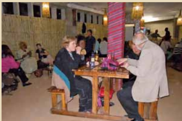
Druženje učesnika konferencije u Ksama kulturnom restoranu