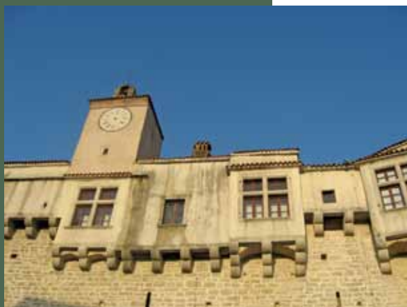
Etnografski muzej u Istri, Pazin

„Profit“ u muzejima je potreban da bismo mogli da funkcionišemo i da našem društvu vratimo lepotu, kreativnost i osećaj pripadanja (nečemu, negde ) ali ovo ne znači prodavanje duše đavolu. Sve je pitanje balansa.