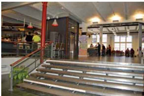
Nekad „finski Mančester“, sada muzejski centar