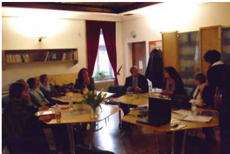
Okrugli sto predstavnika nacionalnih komiteta ICOM-a bivših jugoslovenskih republika