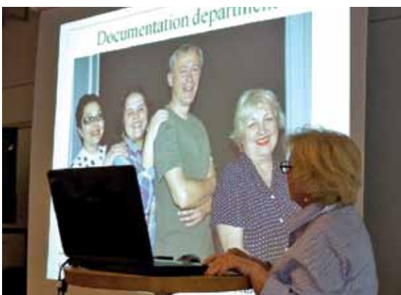
Prezentacija srpskih dokumentarista

CIDOC, međunarodni komitet za dokumentaciju u muzejima i sličnim organizacijama, ustanovljen je 1950. za vreme ICOM-ove Generalne konferencije u Londonu. Sada ima preko 450 članova u 60 država. Članovi su specijalizovani dokumentaristi, arhivari, računarski stručnjaci, dizajneri sistema, konsultanti i predavači.