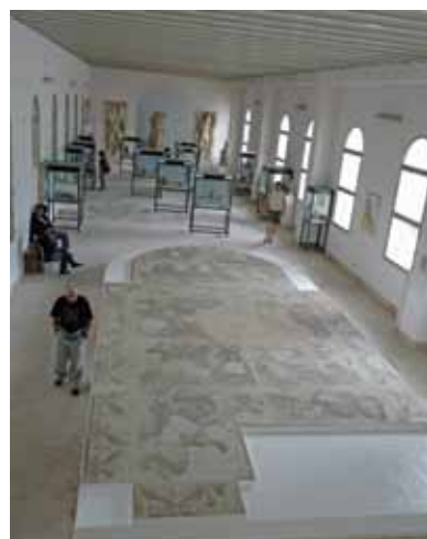
ICOM Srbija, decembar 2012