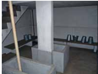
Sauna, Radnički muzej stanovanja Amur

primere o tome kako na nov i inovativan način sačuvati i predstaviti napuštene industrijske oblasti. U četvrtom delu razgovaralo se na temu Igre i interaktivna iskustva u muzejima . Veliko interesovanje izazvale su teme Umrežavanje u inovativnim projektima i Inovativne izložbene tehnologije i koncepti , zbog toga što nam savremene tehnologije nude niz različitih mogućnosti i novih izazova. Nauka i tehnologija kao "univerzalna" nauka pruža odličnu osnovu za praćenje transnacionalnog prepletanja moderne evropske istorije. Nova digitalna tehnologija omogućava da