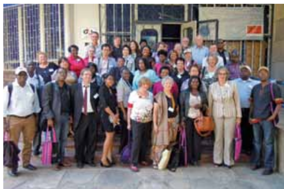
Učesnici konferencije u Vindhuku, Namibija

U tom kontekstu, pohvaljujem ICME za organizovanje međunarodnih konferencija koje omogućavaju ljudima iz celog sveta da konvergiraju periodično i raspravljaju o osnovnim aspektima kulturnog nasleđa. Debate i prezentacije tokom konferencije u Vindhuku stvarno su proširile poglede na ulogu kulture i muzeja u društvu. Među aktuelnim pitanjima u toku razgovora bila su: - Da li su muzeji zaista potrebni? Kultura jeste dinamična, ali da li su promenljive dimenzije inkorporirane u "žive muzeje" (living museums)? Koncept "živih muzeja" bio je, međutim, primljen sa pomešanim osećanjima. Iz afro-centrične