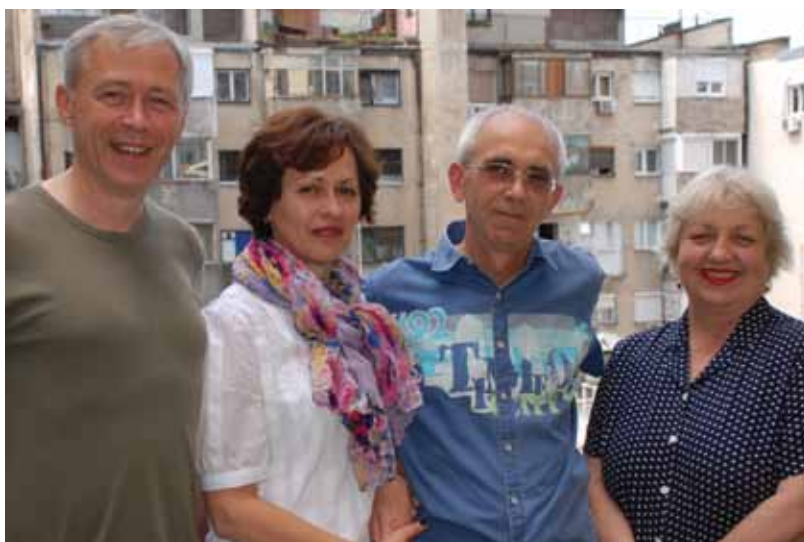
Tim za Helsinki

Glavni događaji odvijali su se u Narodnom muzeju Finske (National Museum of Finland). Sednice, radionice i prijemi održavani su i u Finskoj nacionalnoj galeriji (Finnish National Gallery), Muzeju savremene umetnosti (Museum of Contemporary Art Kiasma), Muzeju dizajna (Design Museum) i Muzeju finskog sporta (Finnish Sports Museum).