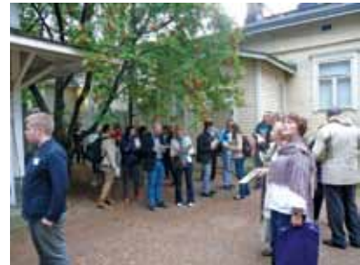
Vodiči, Radnici sela, Radnički muzej stanovanja Amur

načinima i mogućnostima saradnje posetilaca u radu na muzejskim izložbama, u delu Saradnja sa različitim akterima predstavljeni su projekti koje sprovode muzeji i druge institucije u vezi sa zaštitom životne sredine i očuvanjem prirode.