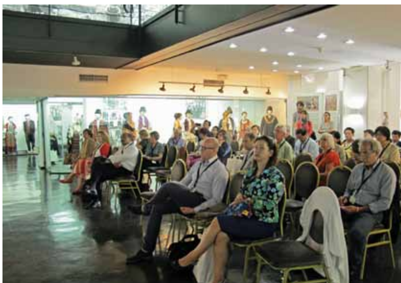
Svečano otvaranje konferencije u Etnografskom muzeju u Beogradu

N a konferenciji je diskutovano o metodama i tehnikama dokumentovanja, očuvanju i tumačenju materijalnih i nematerijalnih aspekata gastronomskog nasleđa. Konferencija je imala cilj da odgovori na sledeća pitanja: na koji način su urbanizacija, emigracija i druge promene u zajednici i porodičnom životu uticali na gastronomiju i materijalno nasleđe? na koji način muzeji dokumentuju i prikupljaju ove promene? kako se tradicija i priče u vezi sa hranom prezentuju posetiocima? koja su nepisana pravila, običaji i navike u gastronomiji; kako se ova pravila ogledaju u materijalnoj kulturi i obratno? Predstavljeni su dobri primeri iz prakse, uspešne izložbe, kooperativne aktivnosti, partnerstva u zajednici, događaji i edukativni programi regionalnih muzeja širom sveta. Činjenica da je ovo druga godina zaredom kako Međunarodni komitet za regionalne muzeje ICR organizuje konferenciju o gastronomskom nasleđu (prva