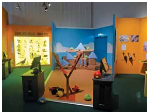
Izložba Ptice u letu, Muzejski centar Vapriki

Uvodničarka Mauranen Katarina je u veoma interesantnom predavanju Pogled iza mašine. Prikazivanje nematerijalne baštine kroz tehnologiju veoma materijalnih artefakata ukazala na problem sa kojim se suočavaju zaposleni u tehničkim muzejima. Predmete tehničkog nasleđa je relativno lako prikazati, ali je teško opisati njihovu istorijsku vrednost i značaj, ili performanse, pogotovo kada sadržaji nisu jasno vidljivi i razumljivi posetiocima. Zato