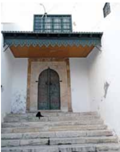
Sidi Bou Said

Muzeji su danas daleko od kabineta retkosti i prvih muzeja koje su mogli da posete samo oni koji su lično poznavali direktora. Napredak se desio još daleke 1793. godine, kada su vrata Luvra otvorena da bi građani bez ograničenja