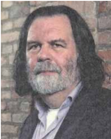
Piter van Menš

U izdanju Muzeja novije istorije u Celju (u okviru tamošnje Škole muzeologije) prošle godine je iz štampe izašla knjiga Novi trendovi u muzeologiji autora Pitera van Menša i Leontine Majer van Menš. Susret sa autorima na regionalnom sastanku ICOM-ovih komiteta u Celju, kada je knjiga i promovisana, iskoristili smo da im postavimo nekoliko pitanja u vezi sa knjigom, odnosno novim trendovima u muzeologiji.