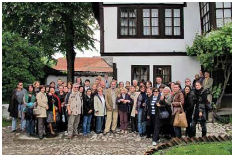
Učesnici ICOM SEE konferencije u Pirotu

Na konferenciji su razmatrani aktuelni rizici za kulturno i