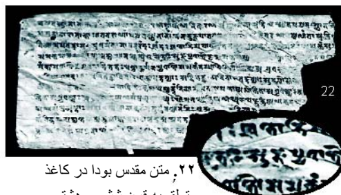
۲۲. متن مقدس بودا در کاغذ متعلق به قرن ششم - هشتم

نسخ قدیمی به رسم خط اندیک و بعضاً باختری ، معمولاً در برگ درختان . ( شکل شماره ۲۲ )