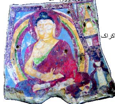
۲۳. پارچه بودا از کارگر