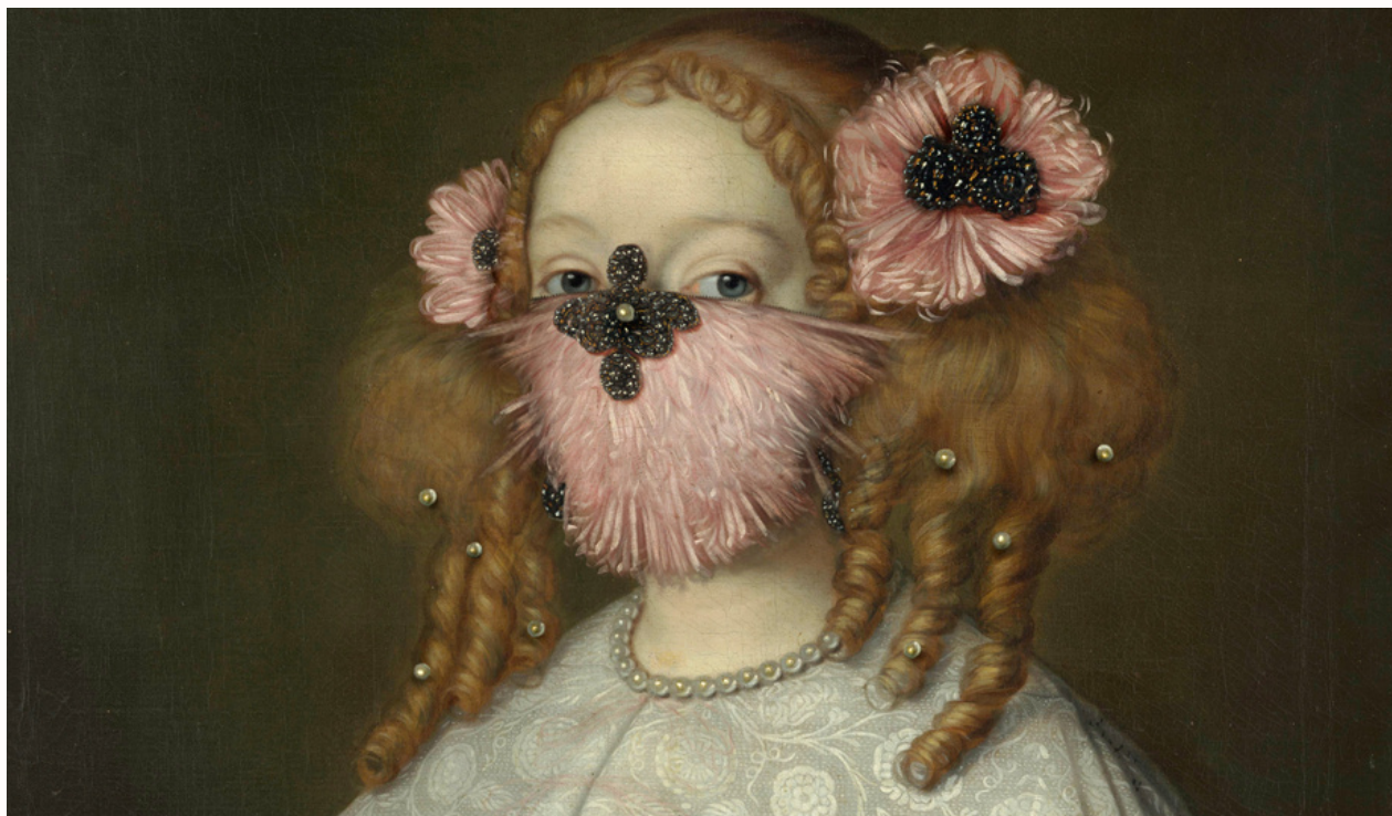
Hidden Van der Helst III, d'après le portrait d'Adriana Jacobusdr Hinlopen par Lodewijk van der Helst, 1667, Rijksmuseum, Amsterdam, Photocollage Volker Hermes, 2020, avec la permission de l'artiste © Volker Hermes

L'exposition virtuelle est financée par une bourse du fond ICOM Solidarité de l'appel à projet 2021, dans le cadre du projet d'ICOM Costume Clothing the Pandemic: Resiliency, Community & Unity Expressed Through an International Collaboration of the COVID-19 Facemask Project/Habiller la pandémie : Résilience, unité et communauté exprimés à travers un projet de collaboration internationale sur les masques Covid-19.